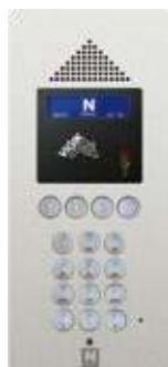
Petit modèle (sans vis apparentes)