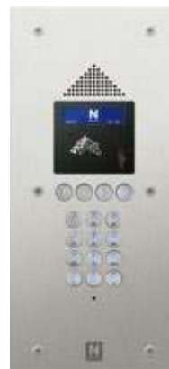
Grand modèle (6 vis antivandales)